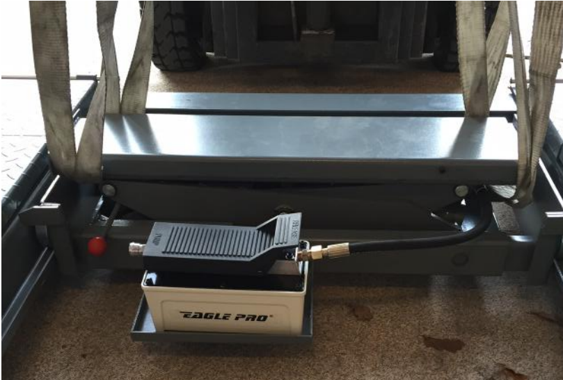
Fig. 1 - Placering af donkraft mellem kørebanerne

1. Mål afstanden mellem kørebanerne og indstil bredden på donkraften, således at den passer med kørerenden. Løft derefter donkraften op og placer den i kørerenden. Kontroller at den ikke skraber imod kørebanerne. Monter derefter bakke til luftpumpe.