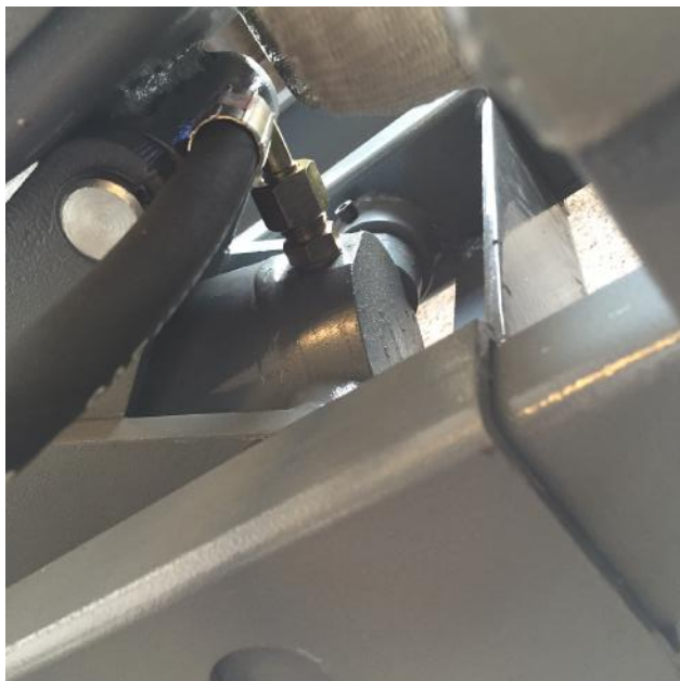
Fig. 4 - Montering af olieslange på cylinder

3. Tilslut olieslangen fra motorenheden til cylinderen. Det kan være nødvendigt at løfte selve løftepladen lift for at komme til.