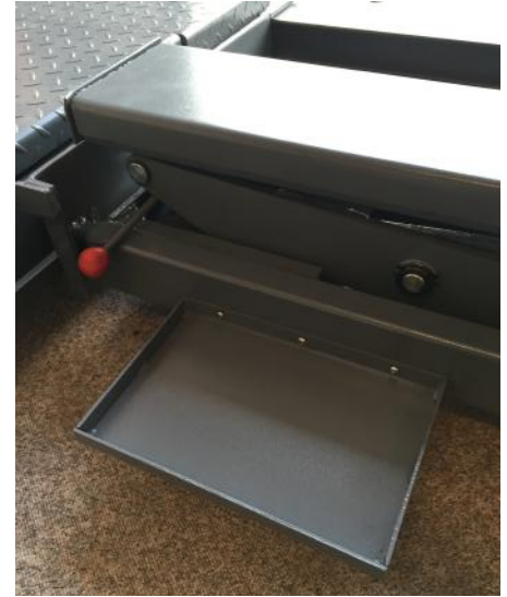
Fig. 2 - Montering af bakke

2. Tilslut oliefitting til pumpen. Brug olietape for at sikre en god tætning.