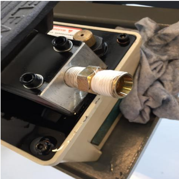
Fig. 3 - Montering af oliefitting

2. Tilslut oliefitting til pumpen. Brug olietape for at sikre en god tætning.