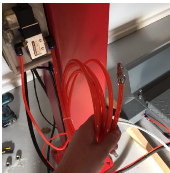
Fig. 5 - Tilslutning af luftslange