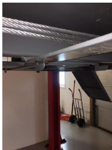
Skal monteres i alle 4 hjørner