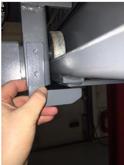
Mål ud ved højeste punkt